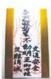
交通安全 カードお守り

歳破の方位に対してやむを得ず普請、動土、移転等をする場合、災いが少ないように祈禱します 奉修方災除祈禱家内安全大麻 大元寺