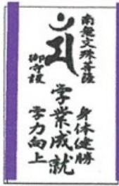
紫：学業成就 知性向上