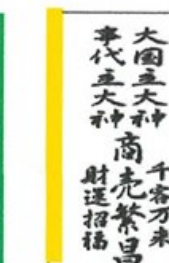
黄：商売繁昌 財運向上