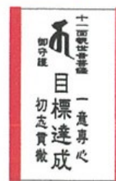
赤：目標達成 向上心アップ